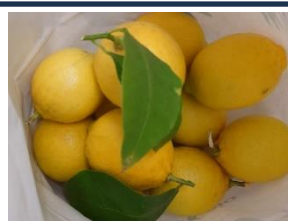
南館のレモンを収穫、給食の鯖に乗りました。