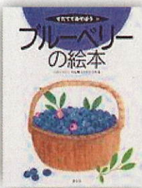
ブルーベリーの絵本 625ぶ