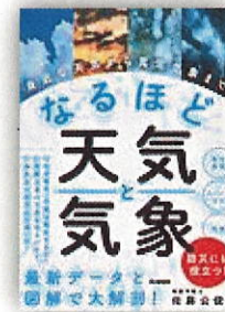
なるほど気象と天気 913お