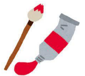
馬橋小学校 図工専科 直本 鉄平