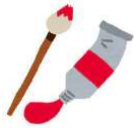
馬橋小学校 図工専科 直本 鉄平