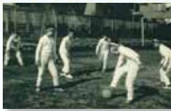
昔の体育授業の様子