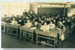
児童数の多かった頃の教室の様子