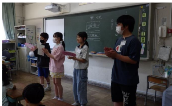
↑たてわり班顔合わせ集会の様子

自己紹介後の時間は、「王様じゃんけん」や「名前あてクイズ」などの遊びをして初めての集会を盛り上げようと頑張りました。たてわり班活動後は、「リアクションを明るくすることで盛り上げることができた」「下級生の名前をたくさん覚えられたから、次回は自分の名前を覚えてもらいたい。」「今までのたてわり班活動が楽しかったのは6年生のおかげだったことが分かった。」などと言った感想がありました。毎回のたてわり班活動に向けて、6年生は1週間以上も前から、遊びを細かく丁寧に計画しています。当日は、最上級生としての責任をもって、下級生のことを気かけながら遊びを進めています。普段関わりの少ない異学年同士が交流することで、上級生の子供たちは高学年としての意識が高まり、下級生の子供たちは上級生から多くのことを学びます。今後もたてわり班の活動をたくさん予定しています。子供たちが輝ける場をたくさん作っていかれたらと思っています。ご家庭でもぜひ、子供たちからたてわり班の様子を聞いてみてください。