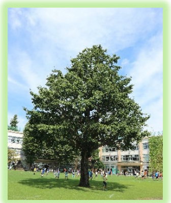
シンボルツリー・いちよう