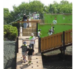
2年生「わんぱく広場」