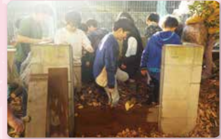
環境委員会(腐葉土作り)