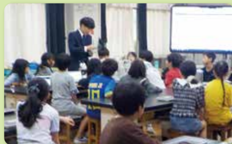
高学年教科担任制による社会・理科の学習