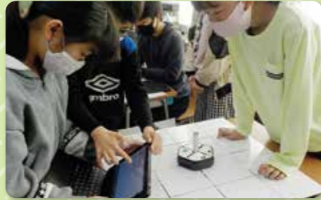
プログラミング教育