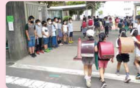
あいさつ運動による交流