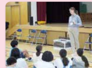
イングリッシュ・キャラバン