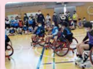
パラスポーツ体験授業