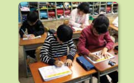
基礎基本の定着学習