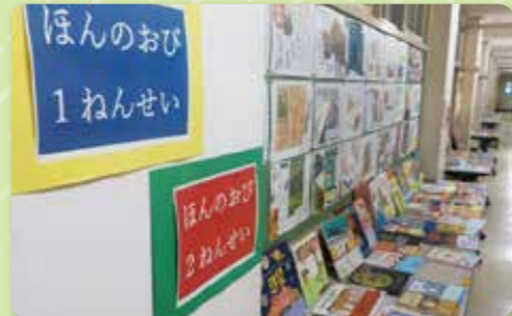
読書活動「本の帯づくり」