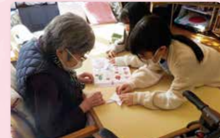
近隣高齢者施設との交流