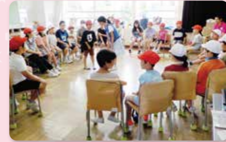
にっこり班活動(異学年交流)

異学年交流及び特別支援学級、近隣施設との交流教育を推進し、互いの人権を尊重し、共生社会の一員としての豊かな心を育みます。