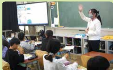
ALTによる外国語学習