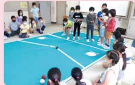
ポッチャを通した異学年交流