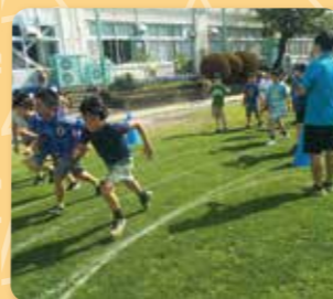
朝のかけっこクラブ