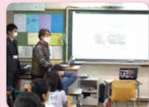
企業と連携したSDGs学習