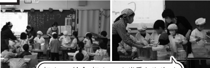
初めての給食、初めてのお当番をサポート