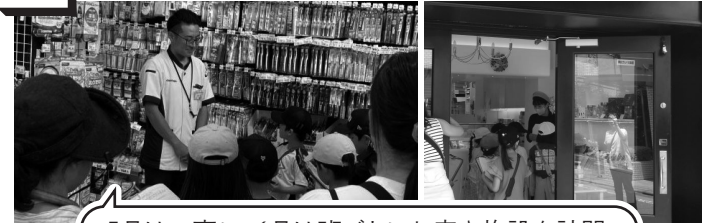
5月は一斉に、6月は班ごとにお店や施設を訪問

3年生 「自転車安全教室」「はじめての書写」 「地域めぐり」「杉並区の農業」 「絵手紙教室」