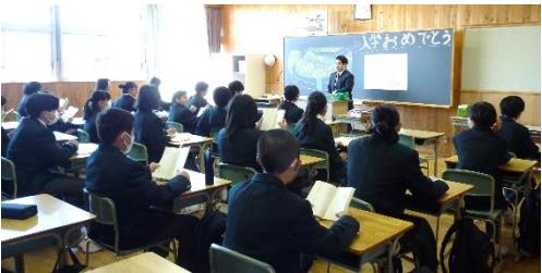
* 1年生 朝読書の様子

図書館からのお願い 春休みの前に借りた本は、 返却期限が過ぎています。 速やかに返却してください。 図書委員会では延滞者ゼロ を目指しています。