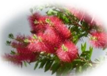
正門前ブラシの木